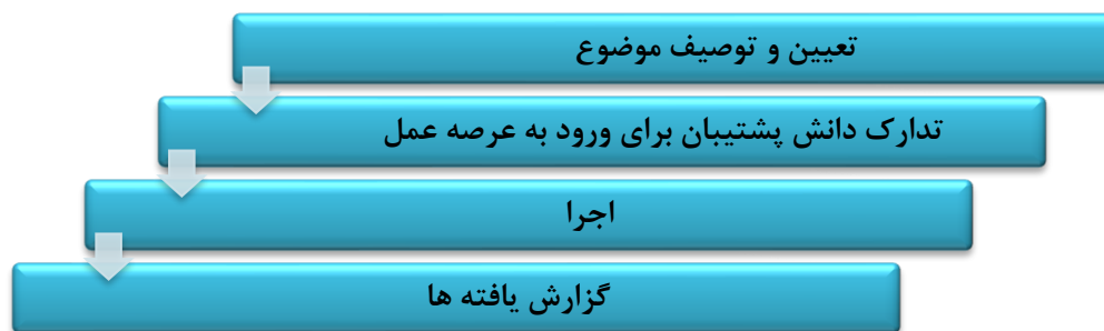
شکل شماره ۲: چرخه درس آموزش پژوهی در عرصه عمل

درس آموزش پژوهی در عرصه عمل در دوره مهارت آموزی به ۲ مرحله تقسیم می شود. بر این اساس مرحله اول شامل «تعیین و توصیف موضوع» و «تدارک دانش پشتیبان برای ورود به عرصه عمل» و مرحله دوم شامل «اجرا» و «گزارش یافته ها» تقسیم می شود. شرح فعالیت های مهارت آموز در هر یک از مراحل فوق، در بند ۵ همین فصل (کاربرگ های ارزشیابی درس آموزش پژوهی) بیان شده است.