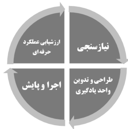
شکل شماره ۴: چرخه فعالیت کارآموزی

این فرایند شامل چهار مرحله است که عبارتند از: «نیازسنجی»، «طراحی و تدوین واحدهای یادگیری»، «اجرا و پایش» و «ارزشیابی عملکرد حرفه ای». شکل شماره ۴، چرخه فرایند کارآموزی را نشان می دهد: